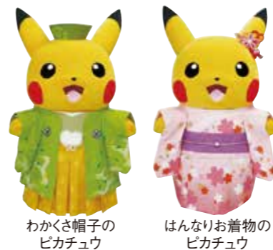
わかさ帽子のピカチュウ はんなりお着物のピカチュウ

10/19(土) ポケモンセンターキョウトから ピカチュウたちが遊びに くるよ!