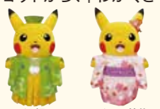
わかさ帽子のピカチュウ はんなりお着物のピカチュウ

ポケモンセンターキョウトから、「わかさ帽子のピカチュウ」と「はんなりお着物のピカチュウ」が遊びにきてくれます。お楽しみに♪