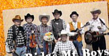
Blue Ridge Mt. Boys